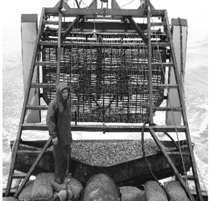
Şekil 2. İtalyan tipi kum midyesi avlama teknesinde direç konumu (A), ülkemiz sularında kullanılan kum midyesi avlama teknesinde direç konumu (B)